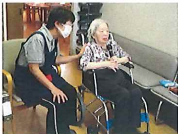
感染対策として、個室 で一人カラオケを実施